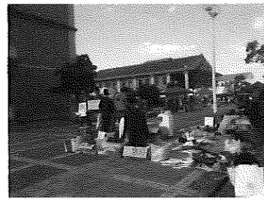
▲商大フリーマーケット