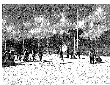
▲垂水区民スポーツの日