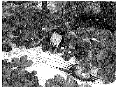
▲畑での作業と収穫