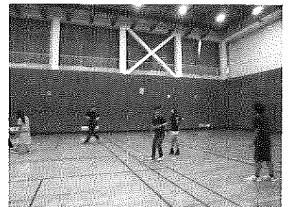
▲体育館でスポーツ